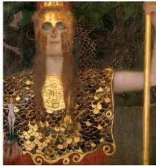
Görüntü 8: Gustav Klimt, "Minerva / Pallas Athena", 1898, tuval üzerine yağlıboya, 75x75cm. 20

Savaş kostümünü tamamlayan miğferindeki baykuş onun bilgeliğini ve düşmanlarına ölümü çağrıştırmaya yadsınmaz. Rembrandt'ın eserlerindeki etkileyici ışık vurgusu, renk anlayışı ve portrenin ifadesi Athena'nın tanrısallığını ortaya çıkarmıştır. Sanatçıların mitolojik konuda oluşturduğu portre ustalığının önemli yapıtlardan birisidir. Athena silahlı olarak doğmuştur, bundan dolayı miğferi ve kalkanı ile tasvir edilir. Baykuşu onun savaşlardaki uğurudur.