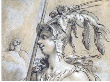
Şekil 4: Hendrik Goltzius, Minerva, 1596, kâğıt üzerine siyah ve kırmızı tebeşir kalem uygulaması, 19,4x14,7cm, Sanat Sarayı Müzesi (Sanat Akademisi Koleksiyonu). 12

lik düşüncelerini sınırsızca aktarmakta özgürlük sağlamıştır. Yunan tanrıçası Athena ve Roma tanrıçası Minerva bu tanrıçalardan en önemlilerindedir.