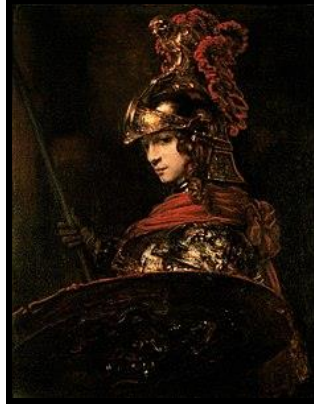
Şekil 7: Rembrandt,"Palas Athena", yak.b 1655, Tuval Üstüne Yağlı boya, 118x91cm, Maseu Calouste Gulbenkian, Lizbon. 19

Rönesanas döneminde mitolojik konulu resimlerde, Hıristiyanlık konularındaki gibi kesin kurallar konmadığından, sanatçı efsanevi tanrıçalar sanatçılara kadın vücudunun tamamını sergileme özgürlüğünü vermiştir. Barok döneminde de "Bu dünyayı öte dünyanın konularıyla ustaca birleştirmeyi başaran Rönesans ressamı yeniden örnek alınmaya başlandı". 18 Kendinden önceki dönem eserleriyle karşılaştırıldığında Rembrandt'ın tanrıça Athena'sının yalnızca yüzünün görülmesi düşündürücüdür. Sanatçı bu eserinde tanrıçanın güzellik vurgusundan çok, savaşçı yönünü öne çıkarmıştır. O, bu eseri ile farklı bir güzellik anlayışından mı söz etmiştir ya da toplumun kadına olan bakış açısını değiştirmek yönünde bir mesaj mı vermek istemiştir bilinmez.