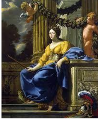
Şekil 6: Simon Vouet, Avusturyalı Anna'nın Minerva olarak Alegorik Portresi, 1640, tuval üzerine yağlı boya, 202x172cm, Hermitage Müzesi, Saint Petersburg. 17

"Bilgeliğin Kişiselleştirilmesi" (Şekil 5) olarak adlandırılan, Hendrik Goltzius'un "Minerva"'sının çıplak tasviri, onun cinsiyetinin vurgusu gibidir. Toplumun ezberlerinden uzak, onun savaş tanrıçalığının sembolü, başındaki miğferi, sağ elinde tuttuğu mızrakı ve sol kolunun yaslandığı miğferi olarak görülür. Oturduğu yerdeki bol dökümlü kumaşlar, onun vücut kıvrımlarına uyumlu bir tekrar oluşturmaktadır. Arkada, savaşçı kostümleri içerisinde, baykuşun kulaklarına benzer kulakları ile uhrevi aleme aitmiş gibi görünen asker ve ikisinin arasında duran Minerva'nın baykuşu bulunmaktadır. Baykuşun yorgun duruşu, uzun süredir tanrıçanın koruyucusu olduğuna işaret eder gibidir.