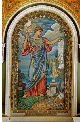
Şekil 9: Elihu Vedder, Barış Minervası, 1897, Mozaik, boyutları bilinmiyor, Kongre Kütüphanesi Thomas Jefferson Binası, Washington, ABD. 21

“Minerva/Palas Athena” (Şekil 8) isimli simgesel ve süslemeci üsluptaki Klimt’in eserinde tanrıçanın portresi dikkat çekicidir. Sanatçı eserinde savaştı bir kadının ifadesinde kadının dişiliğini ön plana çıkarmıştır. O’nun üslubu olan, dekoratif unsurlar, altın rengi tanrıçanın maddi gücünü çağrıştırırken, mızrağı, miğferi ve Medusa’nın yer aldığı kalkanı gücünü vurgular niteliktedir. Elinde tuttuğu küçük çıplak peri, onun bütün görsellerinde görülemeyen halinin biçimi gibidir. Sanatçı eserinde tanrıçanın kutsal kuşu baykuşu, koyu fonda gizlemiştir. Klimt’in bu simgesel eserindeki kadının güzelliğinin yanında gücünün simgesel tasvirini Yunan-Roma’nın tanrıçası Athena/Minerva ile yapmış olması düşündürücüdür.