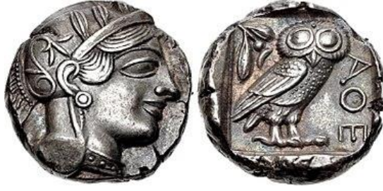
Şekil 1: 454-404 M.Ö Atina antik kentinde darp edilmiş Tetrardrahmi. Sikke ön yüzde küpeli, kolyeli attika miğferi ile Athena, arka tip Baykuş arkasında zeytin dalı önünde ΑΘΕ lejanti. 1

Yunan mitolojisinde baykuş, Athena'nın atribü olması nedeniyle, Atina'nın sikkelerinin üzerinde yer alırken çeşitli dönemlerde sanatçıların eserlerinde de tanrıçayla birlikte yar almıştır (Şekil 1). "Atina'nın koruyucu tanrıçası Athena'nın M.Ö. VI yüzyılın ortalarında kullanılmaya başlanılan, tahıl ihtiyacını karşılamak üzere, sikkelerin sermayeye dönüştüğü, yüzyılın sonlarına doğru basılan bir yüzünde tanrıçanın diğer yüzünde baykuşun olduğu bu tasarım üç yüzyıl boyunca hiç değişmemiştir". 2