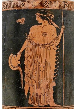
Şekil 3: Brygos, Miğfer ve mızrak tutan Athena, baykuşla birlikte, MÖ 480-490 do- laylarında, Metropolitan Sanat Müzesi. 10

Yunan günlük hayatına ait bir vazounun üstünde görülen (Şekil 3) çalışmada Athena'nın elinde miğferi; gücü, etkilenmezliği ve Romalılara göre görünmezliği sembolize etmektedir. Sol elinde tuttuğu mızrağı savaştaki başarısını çağrıştırmaktadır. Göğsünde Medusa'nın başı, yılanlı giysisi ve bilgeliği simgeleyen baykuşuna yönelik, baş kısmı profilden görülürken, vücudu karşıya dönük olarak, vazo üzerine resmedilmiştir. Sanatçının elbisesinin kıvrımlarını oluşturma biçimindeki geometrik detaylarının, saçlarının dalgası ve yılanı sembolize eden detaylar döneminin yansıması olarak değerlendirilebilir. Minervanın kadının vücut hatlarına yapılan vurguda göğüslerine dikkat çekilmesi düşündürücüdür.