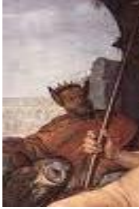
Şekil 5: Hendrik Goltzius, Minerva (Bilgelikğin Kişiselleştirilmesi olarak), 1611, Tuval Üzerine yağlı boya, 214x120cm, Frans Hals Müzesi, Harlem, Hollanda. 15

olarak bilinirken, Tanrıçanın gözlerinin renginin, baykuşun gözüne benzediği de rivayet edilmiştir. “Halkalı koca gözleriyle, avlarını büyüleyerek avlayan, iri kafalı, yavaş hareketleriyle ve avlanırken gösterdiği maharetleri, akıllı ve hünerli yapısıyla Zeus’un kafasından doğan Athena’yı; karanlıktaki etkileyici bakışı, ılık saçan gözleri ve sessizliği bozan sesiyle göktaşını temsil etmiştir”. 14 Hendrik Goltzius (Şekil 4), tanrıçanın gözlerinin tasviri baykuşun gözlerine benzerliği, onun görüş yeteneğiyle ilişkilendirilebilir.