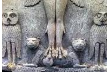
Şekil 2: Gece Kraliçesi, Rölyef, İ.Ö yaklaşık 2300-300- 2000, kalınlık: 49.50 cm x 37 cm, 4.80cm Sümer, Irak, British Museum. 6

Tanrıça İnanna ile ilgili yukarıdaki mitolojide anlatılan hikayeyi doğrular nitelikte görülen (Şekil 2) rölyefte gökyüzünün tanrıçasının yanlara yarı açılmış kanatları, ellerinde hayatı ve yeniden hayata gelmeyi temsil eden Ankh benzeri sembolik anahtar ile yer altı dünyasından yer üstü dünyasına dönerek sonsuz yaşamını elde ettiğini sembolize etmektedir. Aynı zamanda kıyafetlerinden yoksun olması ve yalnızca takılarının varlığı, yer altı dünyasına inerken, karşılık olarak bıraktıklarını düşündürür. Bir diğer bakış açısıyla; aşk tanrıçası olarak bilindiği kadar ölüm tanrıçası olarak da bilinmektedir. Vahşi hayatın en güçlü hayvanı aslanların üzerinde yükselişi ise gücün tasviri olarak tanımlanabilir. Aynı zamanda iki yanda duran baykuşları onun bilgeliğinin ifadesinin yanı sıra Tanrıçanın ölümler diyarına indiği göz önünde bulundurulduğunda ölümün sembolü olarak da nitelendirilebilir.